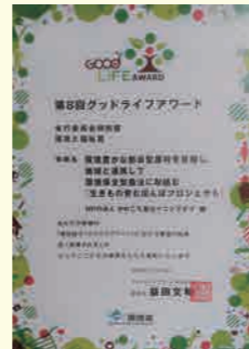
環境省 第 8 回グッドライフアワード 「実行委員会特別賞 環境と福祉賞」