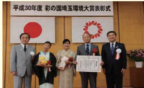
2018 年 彩の国埼玉県環境大賞 「大賞」